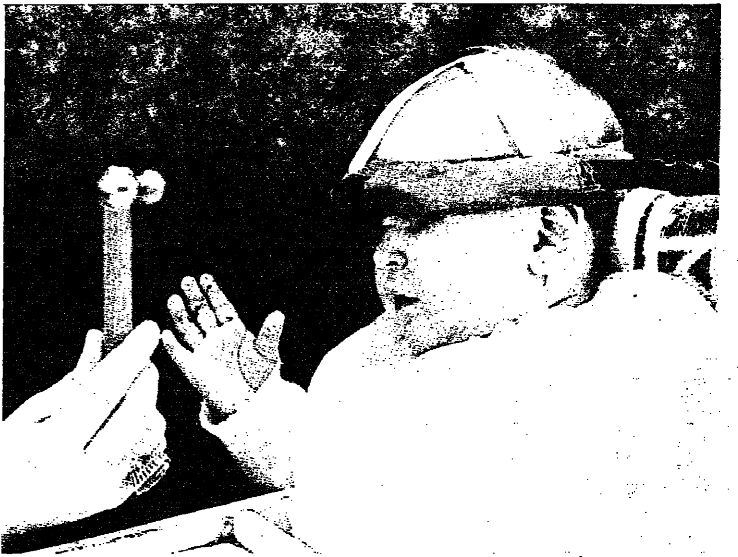
هكذا من الاصل